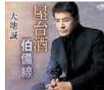
2008年2月6日発売「屋台酒/伯備線」

参加 出場料 3000円/1人 申込時にお支払いください<ふくろうの湯入湯券付> 申込用紙に必要事項ご記入の上 2部門で出場可。その場合、参加料6000円です。 大会事務局に現金書留で送付、もしくは持参来店ください。 =定員になり次第申込を締め切ることがありますので、早めにお申込ください。= 送付先:640-8156 和歌山市七番丁26-1 モンティグレ 2F 岩喜演歌商店内くご当地・歌謡ブルース>和歌山地区大会係